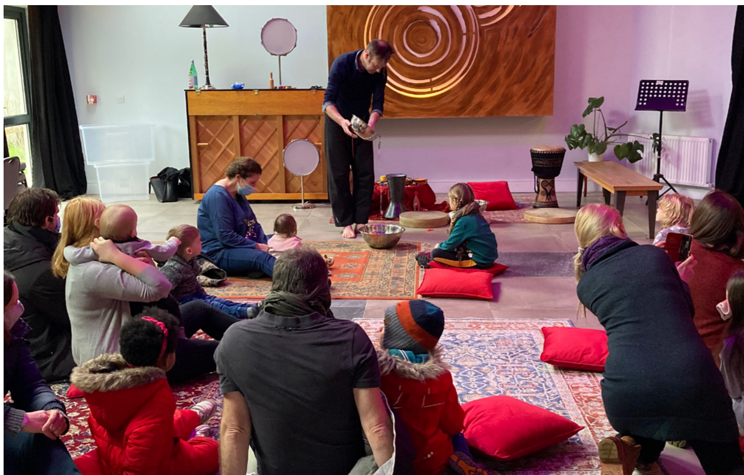
Grasshoppers Early Years Festival.