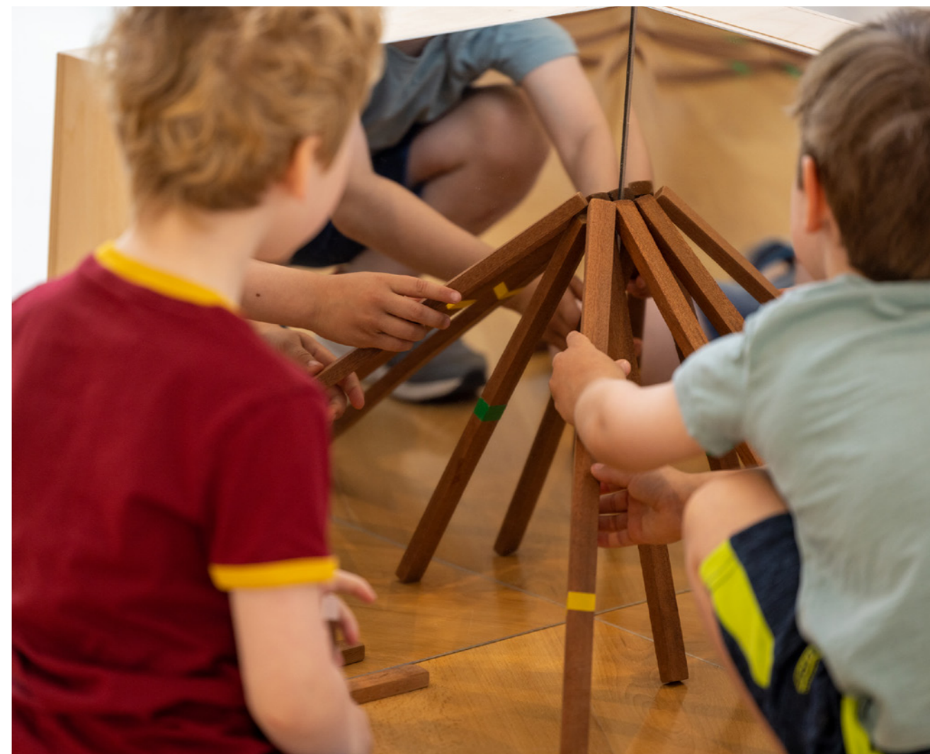
Make space at Draoiicht.

Tá sé mar aidhm ag an bhfís straitéiseach atá i nDréachtphlean Forbartha Chontae Fhine Gall 2023–2029: