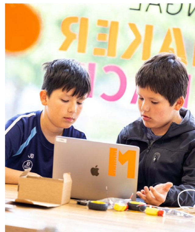
Design a buggy with the Fingalmaker.