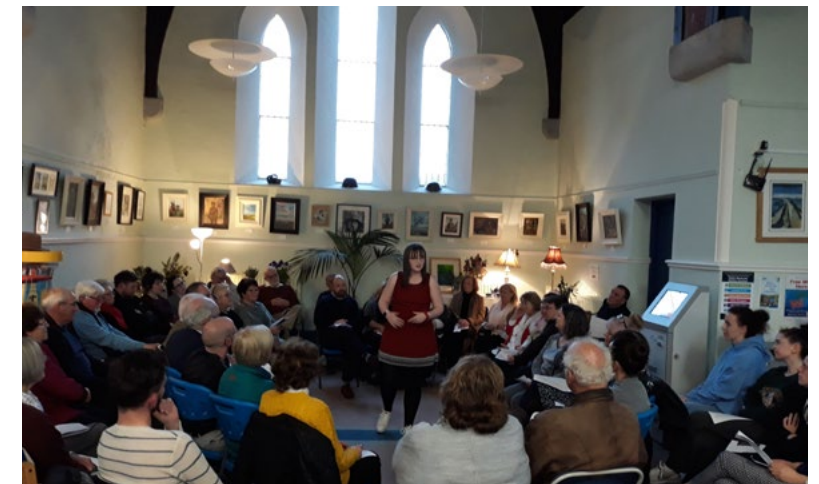
Lá Filíochta Éireann 2018, leabharlann Dún Seachlainn Poetry Day Ireland 2018 in Dunshaughlin Library