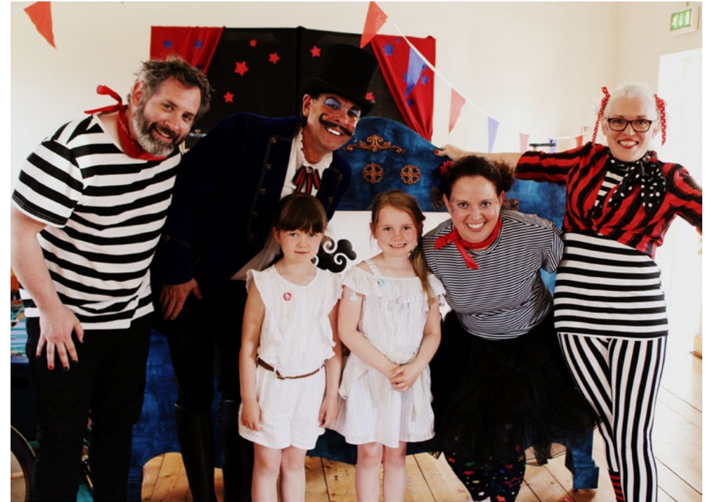
'Me, Molly & Moo' ag Cruinniú 2018 'Me, Molly & Moo' at Cruinniú 2018

Meath County Council recognises that culture is a fundamental element of vibrant and sustainable communities, and that cultural development is an integral part of its vitality, broader social and economic development.