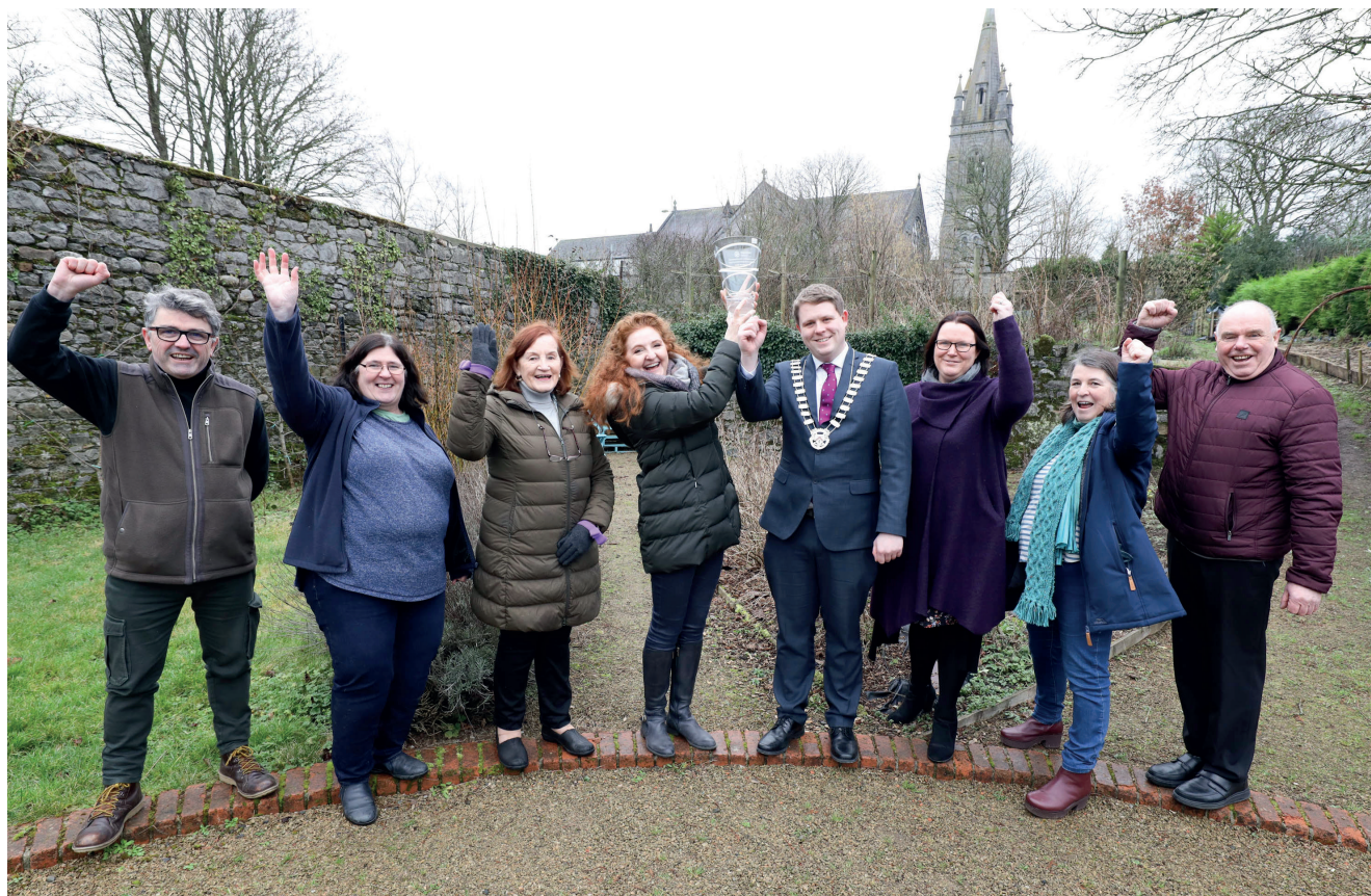
Abbeyleix Climate Action Project, winner of the Sustainable Communities category in the Chambers Ireland Excellence in Local Government Awards 2021.