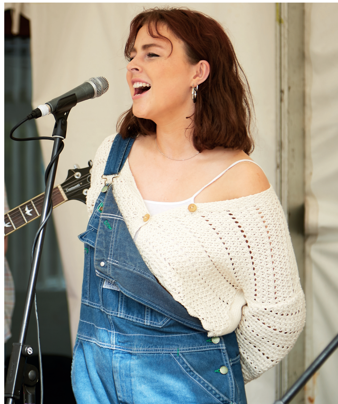
The Glens Street Session 2021

Is chun tacú le rannpháirtíocht, uilechuimsiú daoine agus iad a bheith ábalta iad féin a chur in iúl laistigh de phobail atá i gceist leis an deis a glacadh go fonnmhar i Straitéis Cultúir agus Cruthaitheachta 2023–2027 Lú agus geilleagair áitiúla cruthaitheachta a neartú tuilleadh.