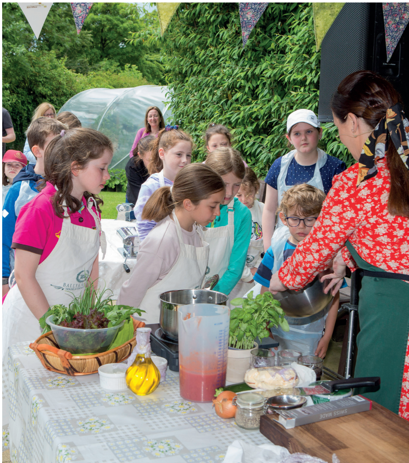
Cruinniú na nÓg Chill Mhantáin. Taispeántas cócaireachta a reáchtáil ag Catherine Fulvio.

dhigiteach a bhaineann le doiciméid stairiúla ón aois seo caite, féile litríochta a bhunú, conairí scéil, scannáin faoin dúlra, siúlóidí folláine agus clár suntasach do Chruinniú na nÓg.