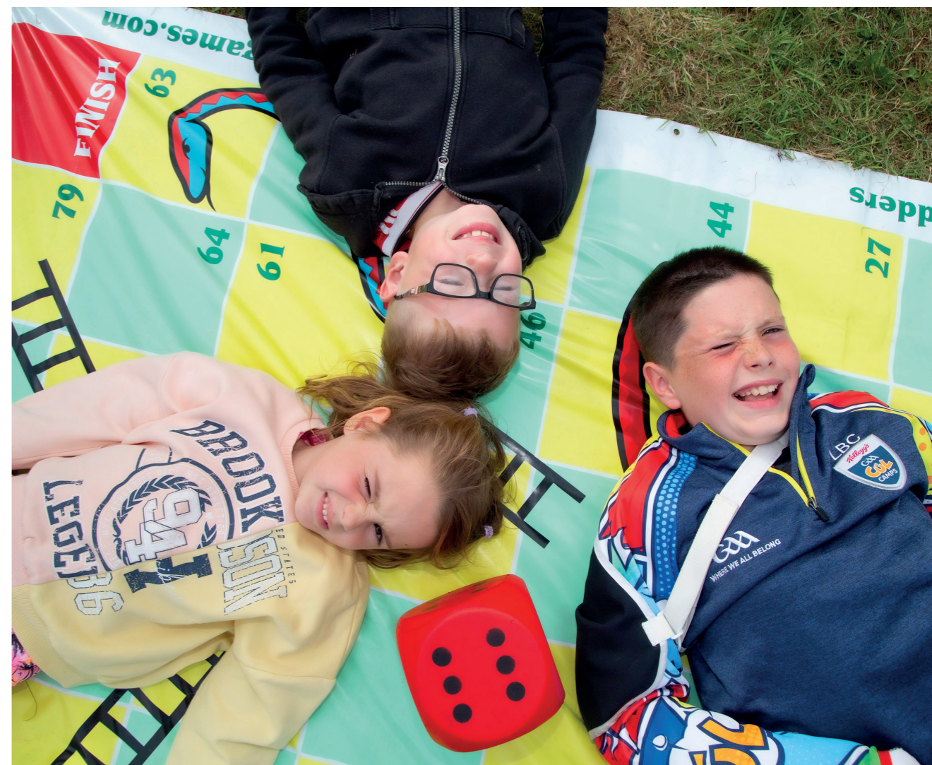
Amhráin Samhraidh Ráth Droma Ar Talamh & Ar Muir.

Tá gréasán bríomhar féilte agus eagraíochtaí cultúrtha áitiúla atá faoi threoir oibríthe deonacha bunaithe i gCill Mhantáin a bhfuil ról lánach acu i gcúrsaí