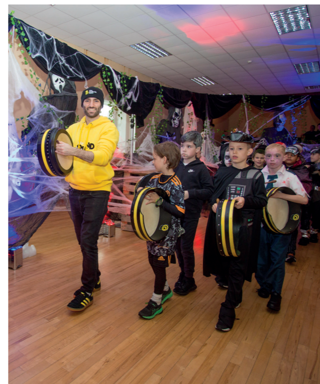
Bunscoil Ráth Droma Ceiliúradh ar an gClár Ildánach.