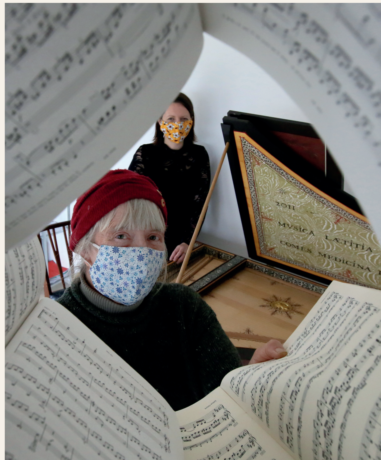
Cónaitheacht Teagasc Oeoil le Sonamus.